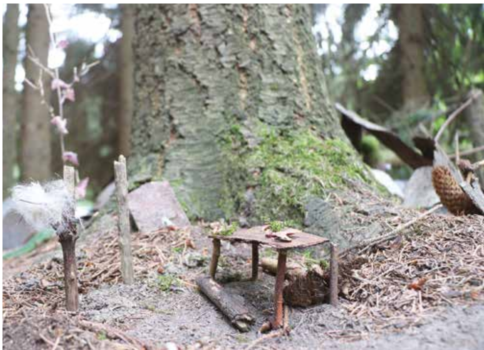
Solche Bauwerke finden sich überall im KIEWA. Kinder können hier ihre Kreativität ausleben.