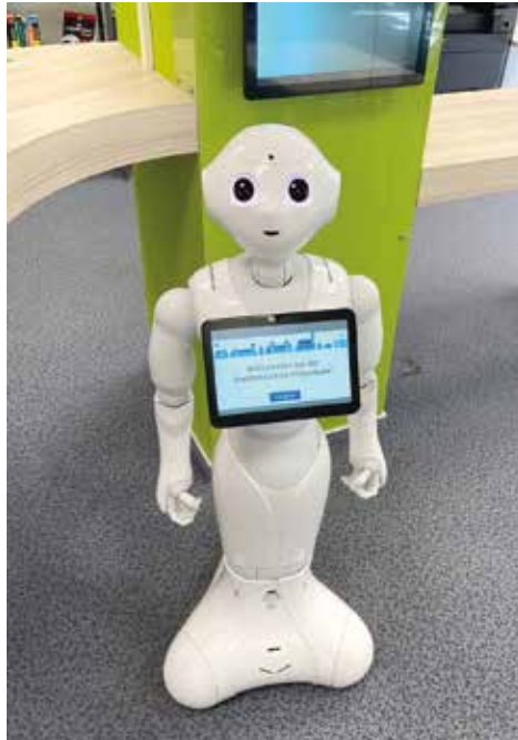
Roboter Pepper ist der neue Mitarbeiter der Stadtbibliothek.

Die Stadtbibliothek hat für den Ausbau der Vermittlungsangebote in der digitalen Bildung weitere Fördermittel in Höhe von 50.000 Euro über das Projekt „Wissens-Wandel“ erhalten. Das bundesweite „Digitalprogramm für Bibliotheken und Archive innerhalb von Neustart Kultur“ unterstützt auf Antrag der Stadtbibliothek den Ausbau der Robotik-Angebote und die digitale Leseförderung. Ziel des Projektes „Erleben und begreifen – Schriftsprache, Coding und Robotik“ ist, generationenübergreifend den bewussten Umgang mit digitalen Medien und Technik zu fördern. Damit wird bei Kindern ab 9 Jahren und Erwachsenen Neugier auf die Auseinandersetzung mit Algorithmen, Programmcodes und Robotern geweckt.