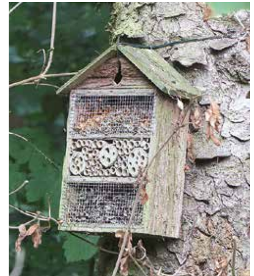
Insektenhotels gibt es überall im KIEWA.

Das Fachwerkhäuschen hat Matthias Kühn saniert. Ein kleiner Ofen steht an der Wand, von der Decke hängen Plastikflaschen. Kinder haben in einem Workshop daraus Glühlampen gebastelt. Der Bauhof hat geholpen