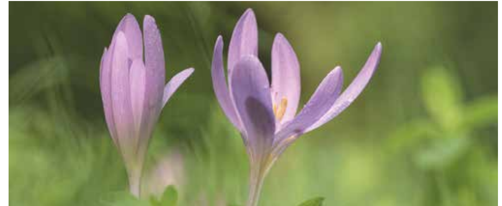
Die Herbstzeitlosen sind eine seltene Schönheit.