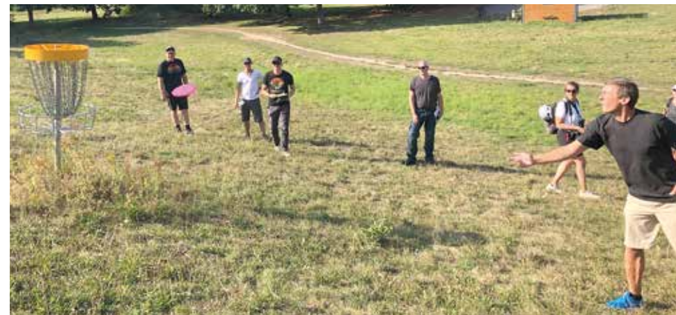
Disc-Golf ist spielend leicht.