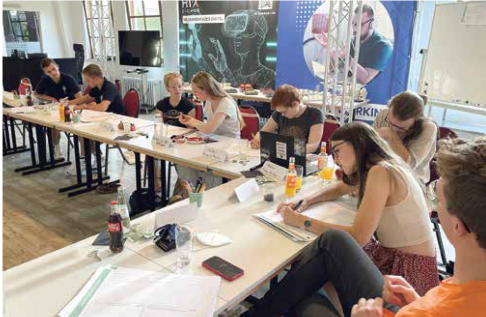
Jugendorganisationen erarbeiteten beim gemeinsamen Workshop mit Hi Zukunft und HI-REG Ideen für die Smart City Hildesheim.