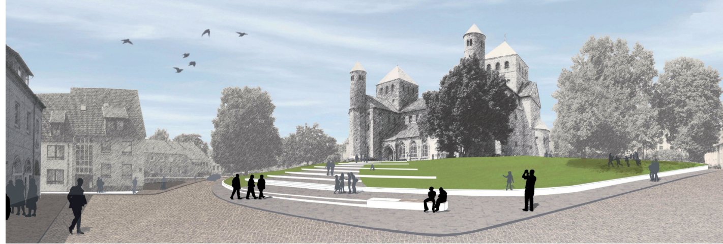
© Prof. Nagel, Schonhoff und Partner, Hannover

Im Rahmen der Investitionen in nationale UNESCO-Welterbestätten und des vom Bundesministerium für Verkehr, Bau und Stadtentwicklung (BMVBS) und dem Bundesamt für Bauwesen und Raumordnung (BBR) geförderten Experimentellen Wohnungs- und Städtebaus (ExWoSt) bildet das Michaelisviertel gemeinsam mit St. Michael den Angelpunkt für ein neues Entwicklungskonzept. Darin ist die Kirche auf dem Hügel sowohl für die Gesamtstadt, als auch für das Quartier der herausragende zentrale Ort. Er soll nicht nur für das Jubiläum, sondern auch für die beständige Nutzung eine Neugestaltung unter Wahrung der historischen Substanz erfahren. Das freiräumliche Konzept baut auf den historisch entstandenen Straßen-, Platz- und Hofräumen auf und versucht, diese in ihrer Kennlichkeit, Erlebbarkeit und Nutzbarkeit zu steigern. Hauptziel dabei ist, die Verbindungen zwischen den prägenden Bauten zu stär-