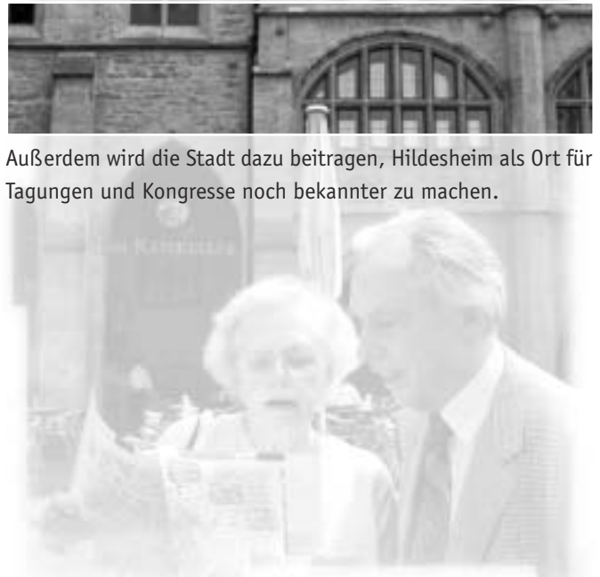
Außerdem wird die Stadt dazu beitragen, Hildesheim als Ort für Tagungen und Kongresse noch bekannter zu machen.

Der Städtetourismus hat sich bundesweit positiv entwickelt, so haben auch die Übernachtungszahlen in Hildesheim dank gesteigerter Marketingaktivitäten zugenommen. Weitere Angebote für den Kultur- und Bustourismus sowie Pauschal- und Wochenendangebote sollen Hotellerie, Gastronomie und Einzelhandel stärken, wobei die Zusammenarbeit mit dem Landkreis Hildesheim, dem Tourismusverband Hannover-Region und dem Verbund der UNESCO-Städte kontinuierlich weiter entwickelt werden soll.